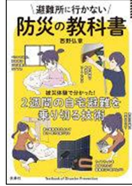
『避難所に行かない 防災の教科書』