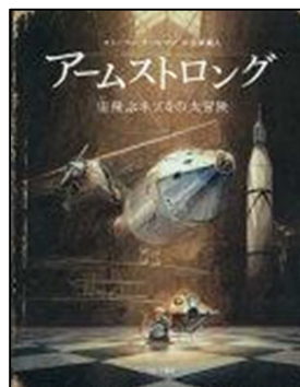
『アームストロング 宙飛ぶネズミの大冒険』