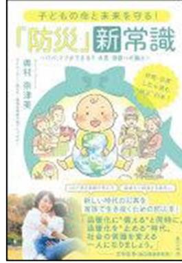
『子どもの命と未来を守る！「防災」新常識』