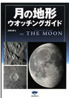
『月の地形 ウォッチングガイド』