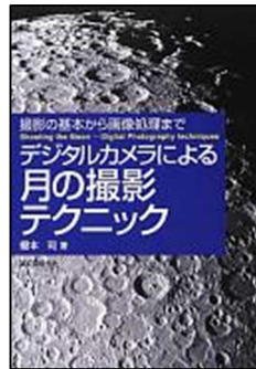
『デジタルカメラによる 月の撮影テクニック』