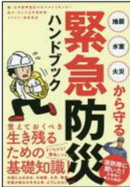
『緊急防災ハンドブック』